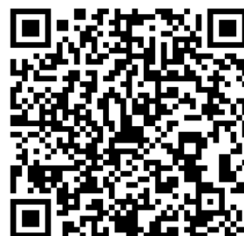
114 學年度運動會暨親子日 QR code