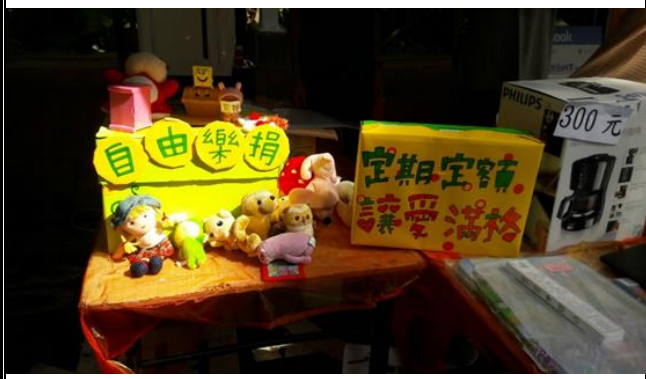
▲扶助弱勢助學募款攤位