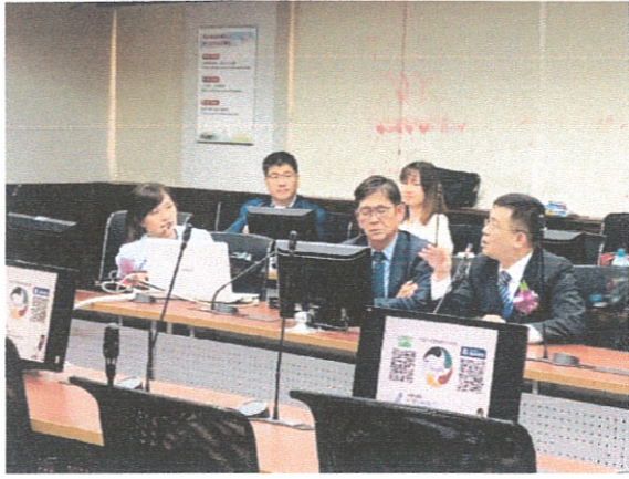
主講者與來賓討論