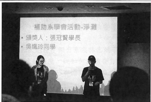
學弟妹們對學長們的感謝詞