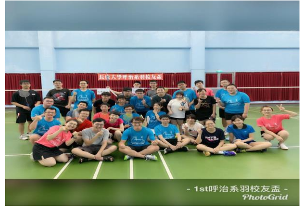
全體參與校友與在校師生大合照