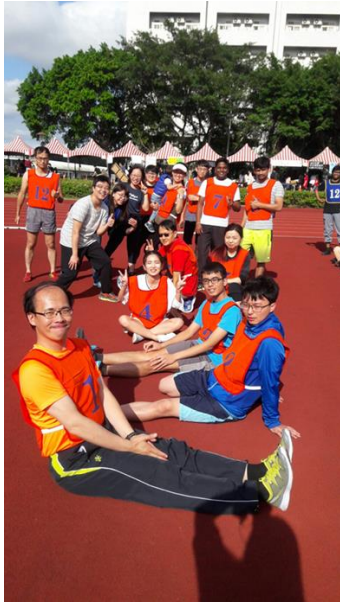
▲ 參加大隊接力跑者