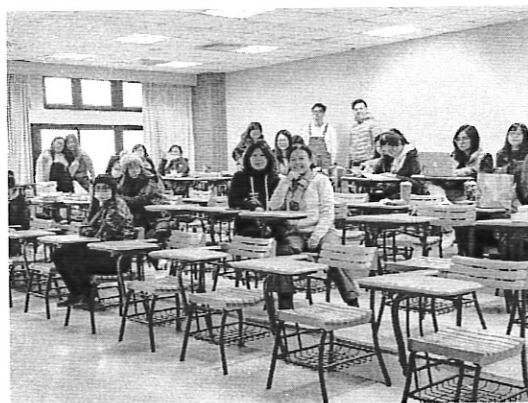
說明 會後參與人員合照