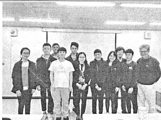
翁若涵系友分享會