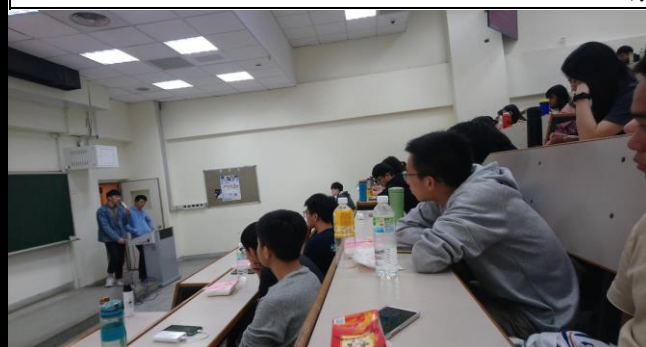
學弟妹們仔細地聆聽學長們分享