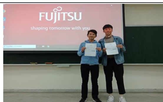
頒發感謝狀給兩位學長