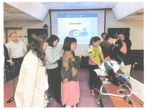
自立如廁心照護實際操作