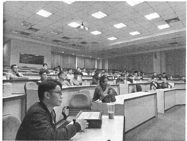
校友參加座談，經驗交流。