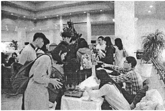
系友&來賓陸續報到