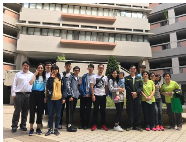
許久不見的學長姐合照