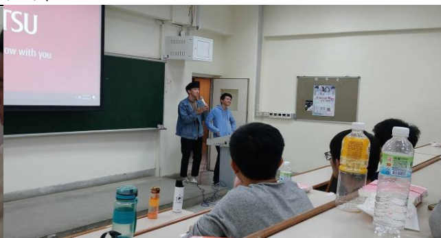
兩位學長分享讀書經驗