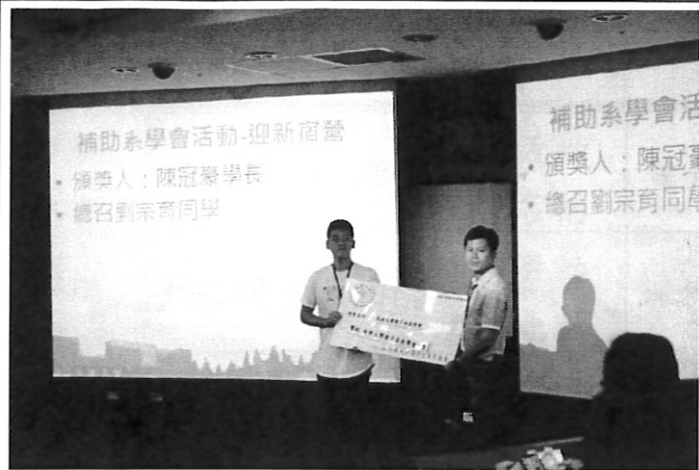
學長對在校生活動(迎新宿營)的支持