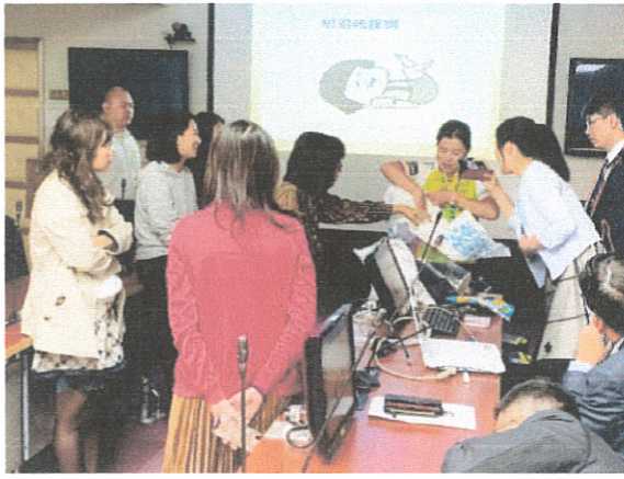
自立如廁心照護實際操作