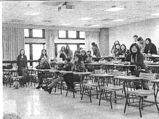
說明 會後參與人員合照