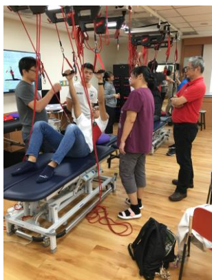
臨床技能中心—由教師示範懸吊系統設備