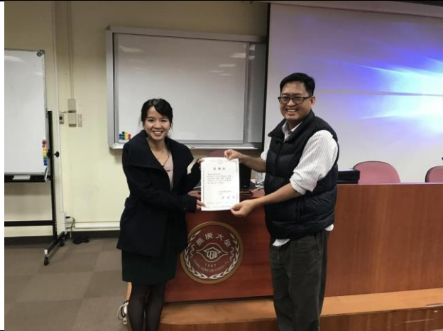
頒發感謝狀 會簽單位