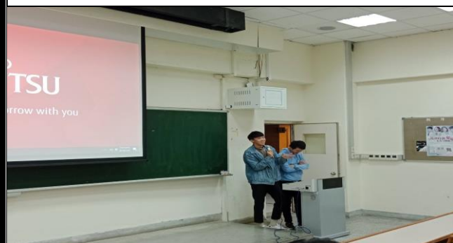
學長們分享有趣的校園生活忍不住笑了