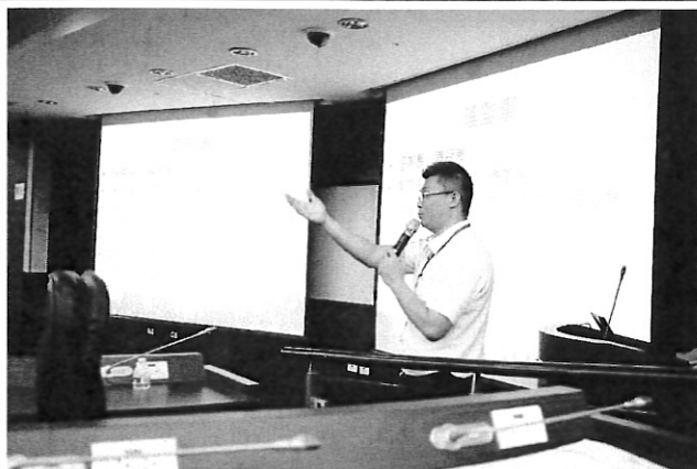
介紹系友會的理監事們