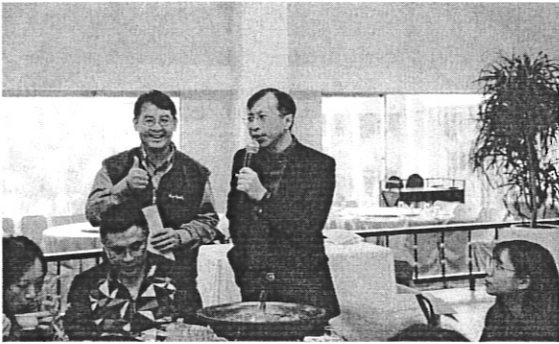
系友工作經驗分享