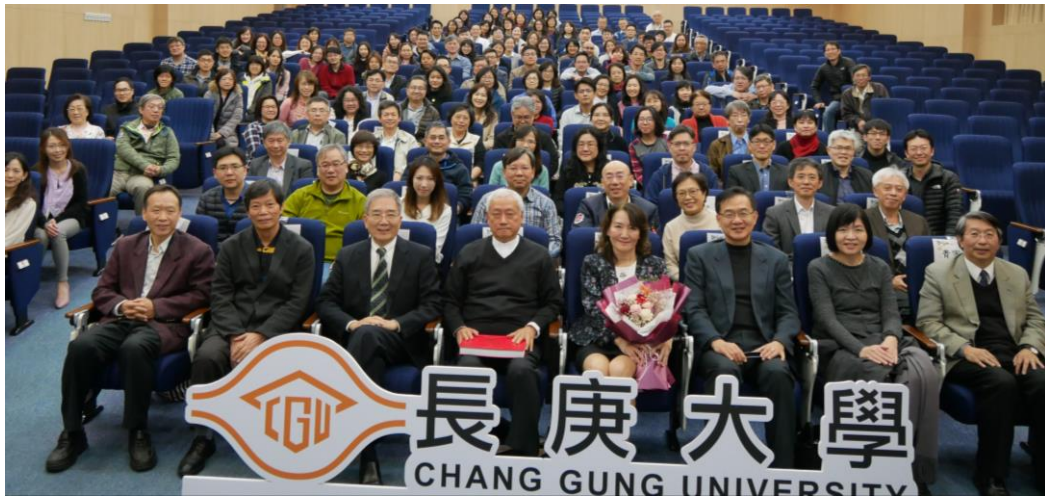
參加活動人員大合照