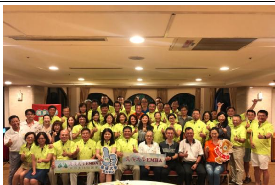
晚宴結束前大合照