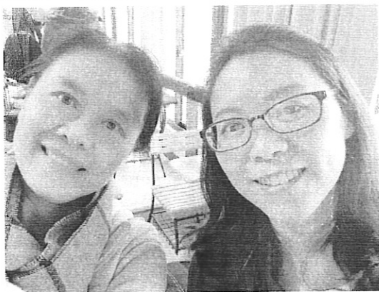
說明 學後護二甲班導師與本次講師合照