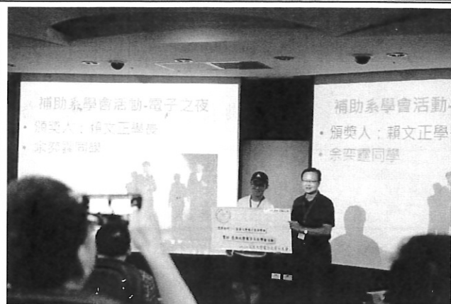
學長對在校生活動(電子之夜)的支持