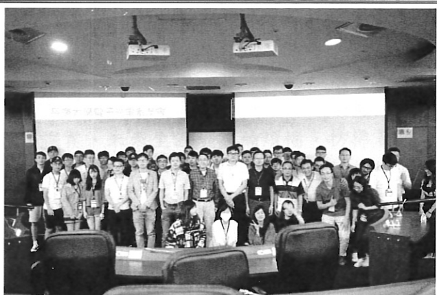
會後系友老師大合照