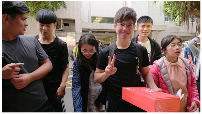
▲募款攤位人潮絡繹不絕