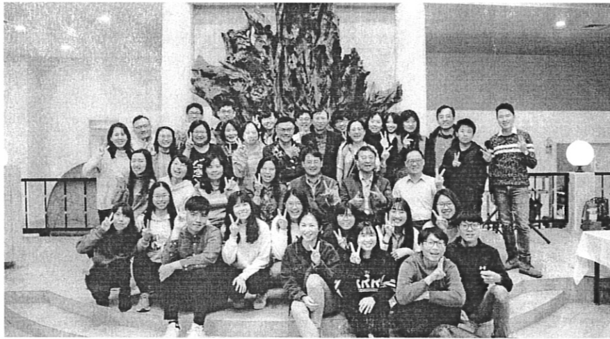
生技系系友會第三屆第二次會員大會大合照