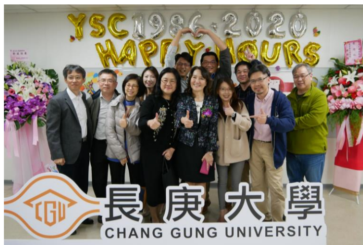
張老師跟現場參加人員合照