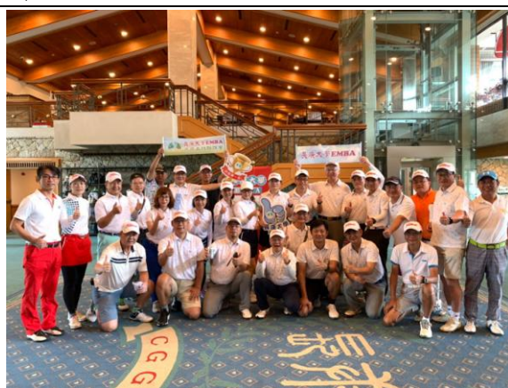
長庚球場大廳合照