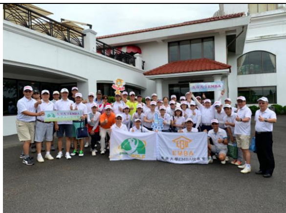
開球之前在出發站大合照